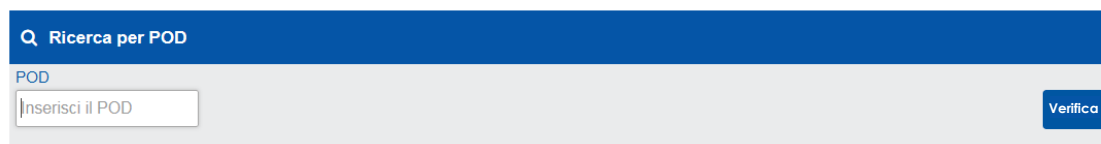
Figura 1: Esempio edit form inserimento POD

Il servizio restituirà l'esito di tale verifica, indicando, in caso di non ammissibilità, la causa di esclusione del POD selezionato.